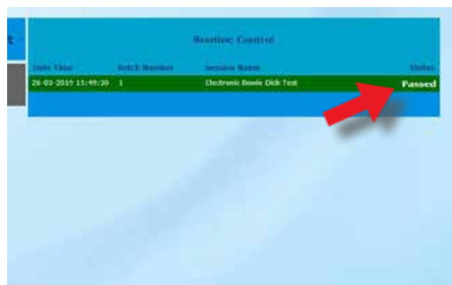
O resultado do teste será aprovado ou reprovado, o que aparece na tela logo após os dados terem sido processados.