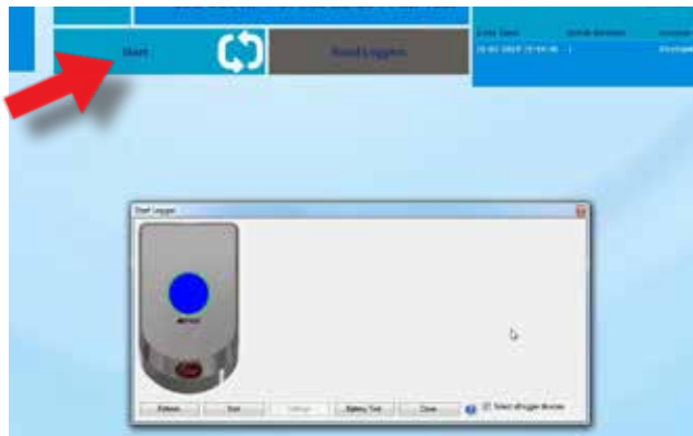
Pressione Start para ativar o dispositivo de medição SteriSense, e coloque o dispositivo dentro do esterilizador a vapor