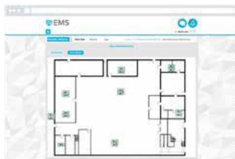
Visualização na planta

O software EMS altamente abrangente leva a exibição de dados de monitoramento ambiental a outro nível. A coleta completa de dados com gráficos interativos, tabelas e vistas de planta permite que os usuários dividam os dados históricos do monitoramento de várias maneiras para análises mais avançadas.